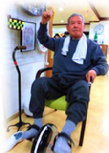
電動サイクルマシン↑ 通称「足こぎ」!人気です!