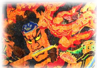
↑作業活動で作ったねぶたの貼り絵です。大作!