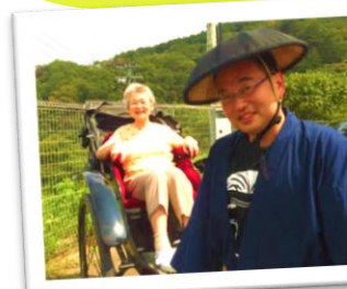
人力車に乗って ちょっとお散歩🎵

外出、調理活動、季節のイベント(夏祭りや運動会など)といったデイケアの行事はもちろん、病院の特色としてイベントが多彩! 毎月様々なことを催しながら利用者様と一緒にスタッフも楽しんでおります!