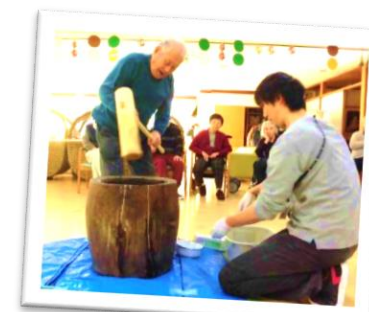
←「ヨイショー!」と 掛け声が飛び交う 餅つき大会!!!